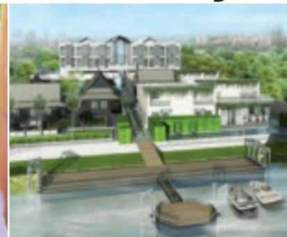
Direkt am Chao Phraya: das «The Siam».